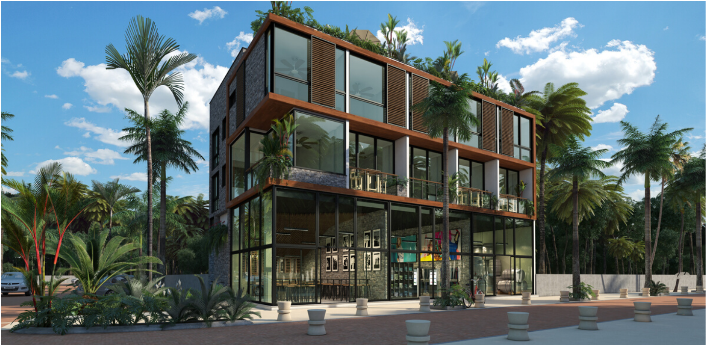
Solo para fines decorativos