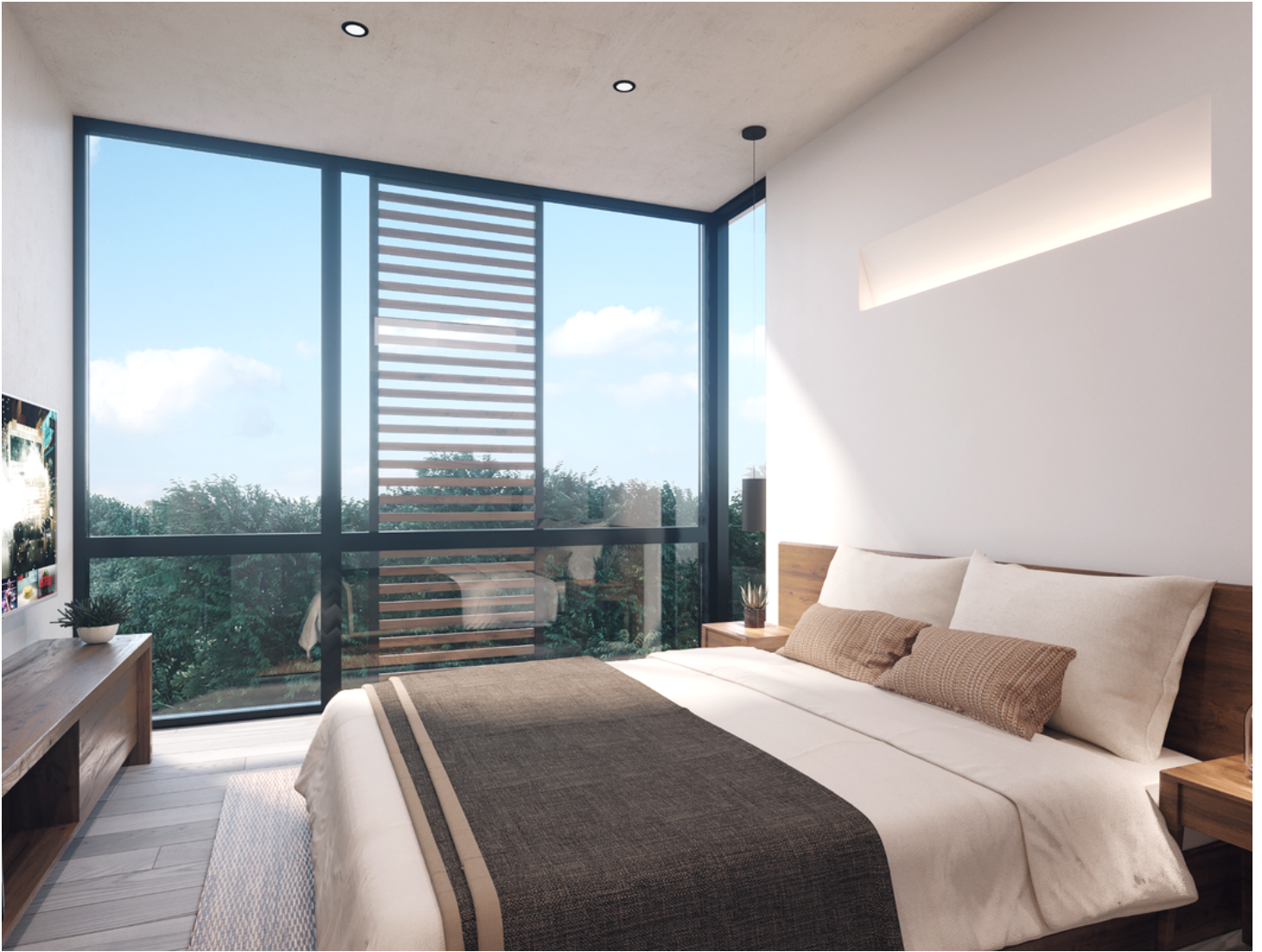
Solo para fines decorativos

Desarrollo pequeño y exclusivo consiste en 5 dúplex colindantes, cada uno dispone de dos habitaciones con un rooftop excelente para reuniones al aire libre y disfrutar de una piscina privada.