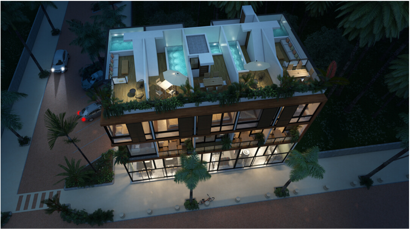
Solo para fines decorativos