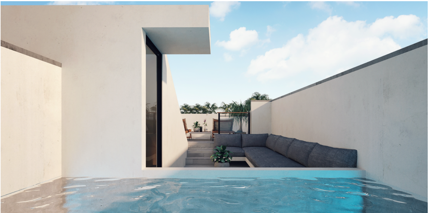
Solo para fines decorativos