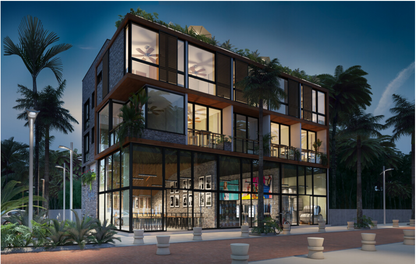
Solo para fines decorativos