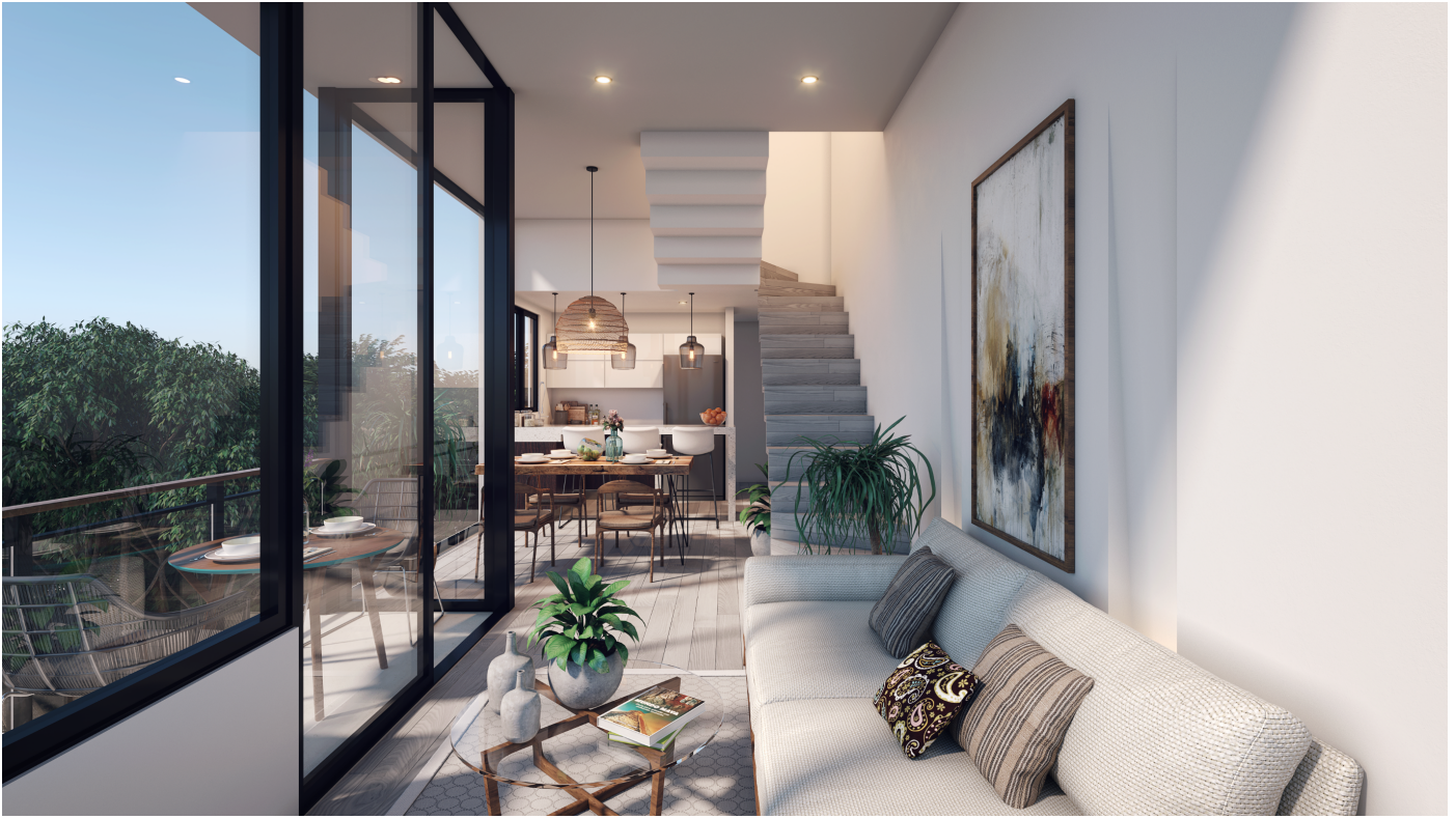
Solo para fines decorativos